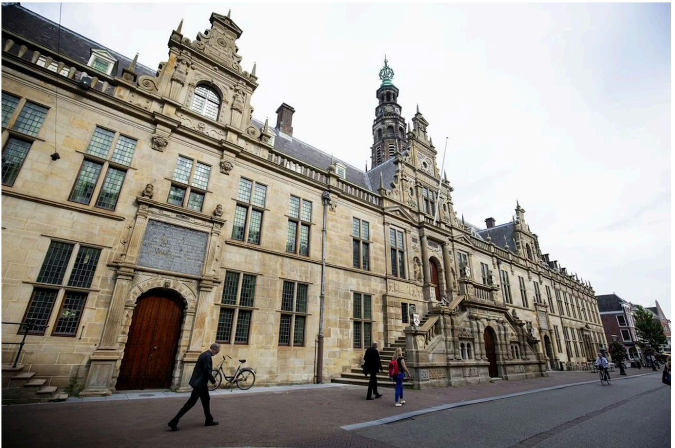
Stadhuis van Leiden. In die gemeente mogen alleen moties met een goede onderbouwing ingediend worden. Sinds die afspraak uit 2010 viel er geen wethouder meer.

De burgers van Den Helder zagen in februari hun wethouders met slaande deuren vertrekken. Dat was niet voor het eerst; in de marinestad staat de teller nu op 26 wethouders die om politieke redenen vertrokken, sinds de gemeentehervormingen van 2002.